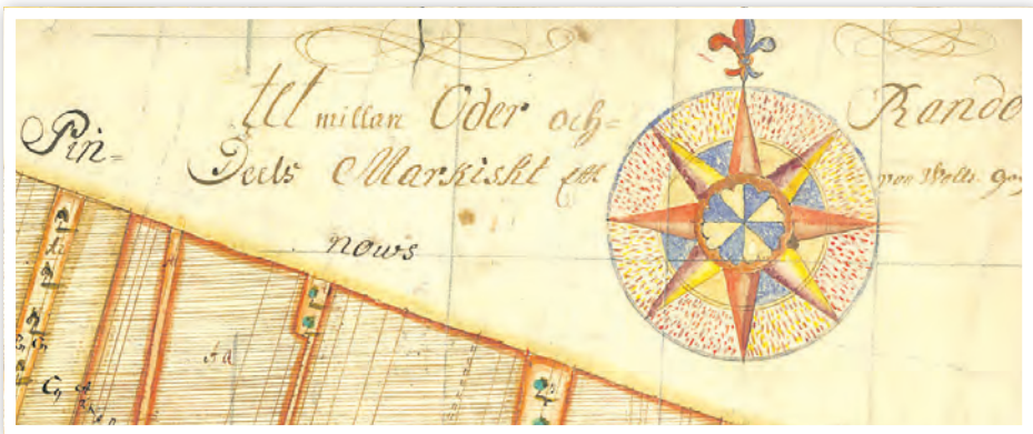
Detail der Matrikelkarte von Kunow aus dem Jahr 1692

Das Ziel ist es, die Bodenfunde, die in Schwedt, in anderen Museen oder beim Landesamt für Denkmalpflege des Landes Brandenburg aufbewahrt werden, nach Schwedt zu holen und ihre Geschichten zu erzählen. Was wissen die