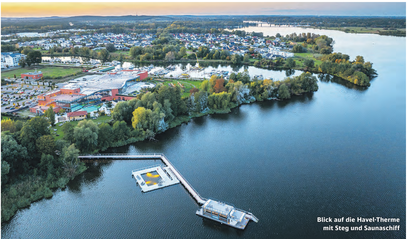
Blick auf die Havel-Therme mit Steg und Saunaschiff

→ reiseland-brandenburg.de/mit-allen-sinnen