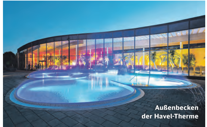
Außenbecken der Havel-Therme

An den sanften Hängen des Werderaner Wachtelbergs wird zudem edler Traubenwein kultiviert, den man in Hofläden