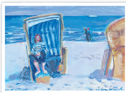
Wolfram Schubert, Frau im Strandkorb, Öl auf Leinwand

Bei der Wahl ihres Motivs und der künstlerischen Umsetzung sind die Künstlerinnen und Künstler völlig freigesprochen. Einzige Vorgabe war pleinair zu malen – also arbeiten unter freiem Himmel. Und so waren im Mai 2025 acht Malerinnen und Maler mit Staffelei, Pinseln und Farben in und um Heringsdorf unterwegs und haben ihre Eindrücke