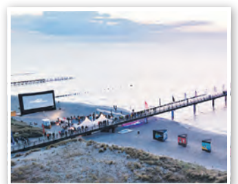
Umweltfotofestival »horizonte zingst«