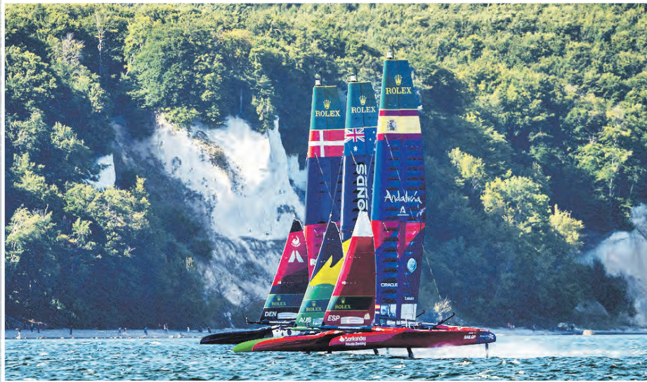
2026 findet zum zweiten Mal die „SailGP“ in Sassnitz statt.

Veranstaltungshöhepunkte 2026 zwischen Ostseeküste und Seenplatte