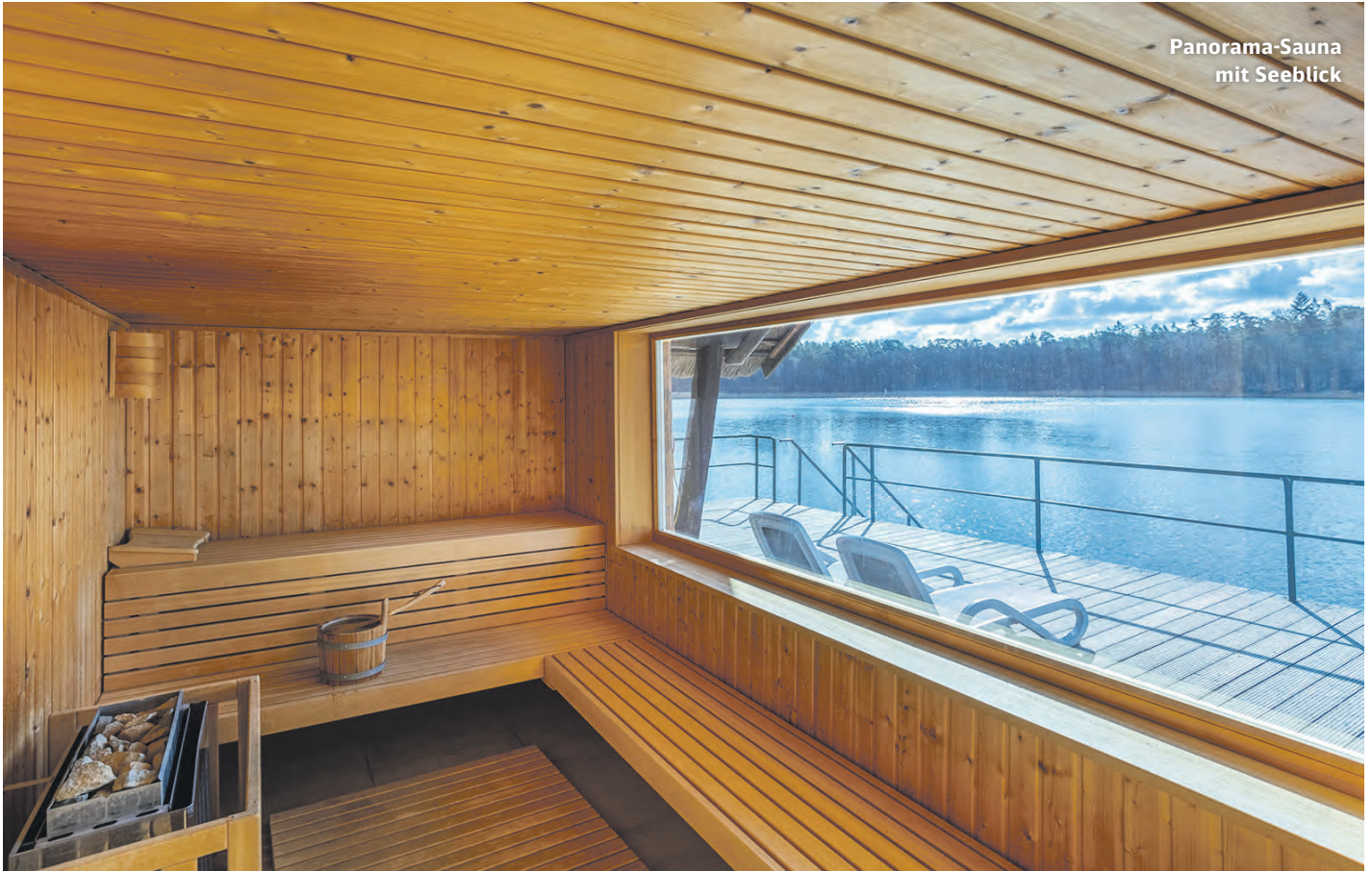
Panorama-Sauna mit Seeblick

Hotel Döllnsee-Schorfheide im Biosphärenreservat Schorfheide-Chorin