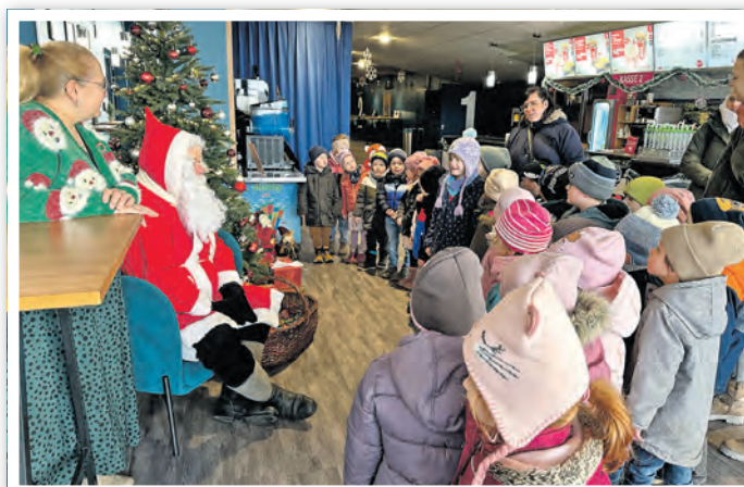
Der Weihnachtsmann mit Rauschebart und Weihnachtsfrau empfängt die Schwedter Vorschulkinder zum Kita-Adventskino

Jeden zweiten Sonntag im Monat um 13 Uhr heißt es „Film ab“ für Kinder ab drei Jahren. Die Reihe „Mein erster Kinobesuch“ schafft einen geschützten