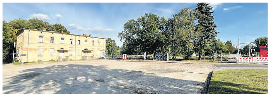
Der Bahnhofsvorplatz in Passow vor der Neugestaltung.

Verkehr kann auf den anliegenden und den anschließenden Straßen Am Bahnhof, Gramzower Chaussee, Passower Bahnhofstraße und Wendemarker Lindenallee weiter fließen. Lediglich mit einem erhöhten Baustellenverkehr ist zeitweise zu rechnen. Außerdem wird im Bereich des Bahnübergangs Tempo 30 angeordnet. Hier befinden sich auch die Ersatzhaltestellen der Uckermärkischen Verkehrsgesellschaft. Die Realisierung ist bis Ende Juli 2026 geplant.