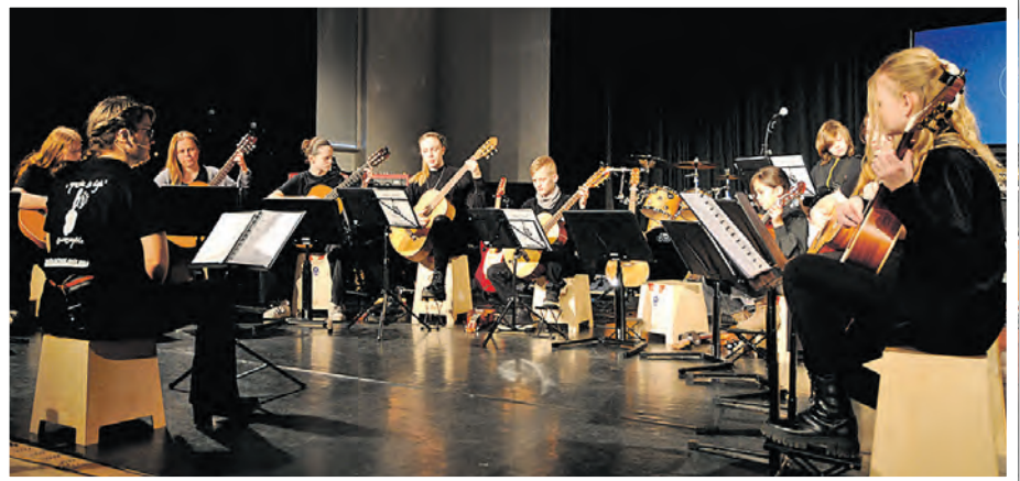
Saitenzauber 2025: das Anfängerensemble „Music is Life“