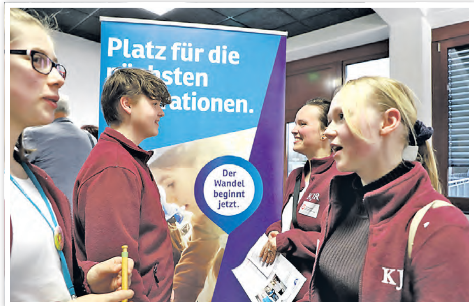
3. Schwedter Zukunftswerkstatt im neuen CAMP.

Auf besonderes Interesse stieß das TRAFÖ. Für den Bau des Zentrums für Transformation hat Schwedt erst kürzlich 18 Millionen Euro Fördermittel erhalten. „Was können wir im TRAFÖ