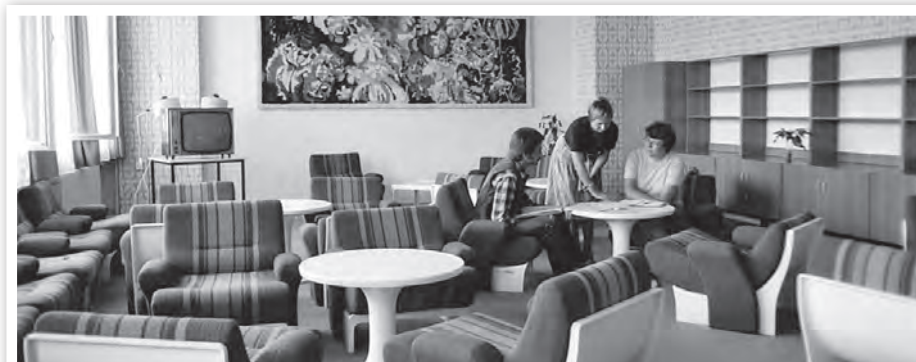
Unterkunft der Montagearbeiter „Roter Ochse“, 1970er Jahre

Erzählen Sie Ihre Geschichte, wir freuen uns auf Sie!