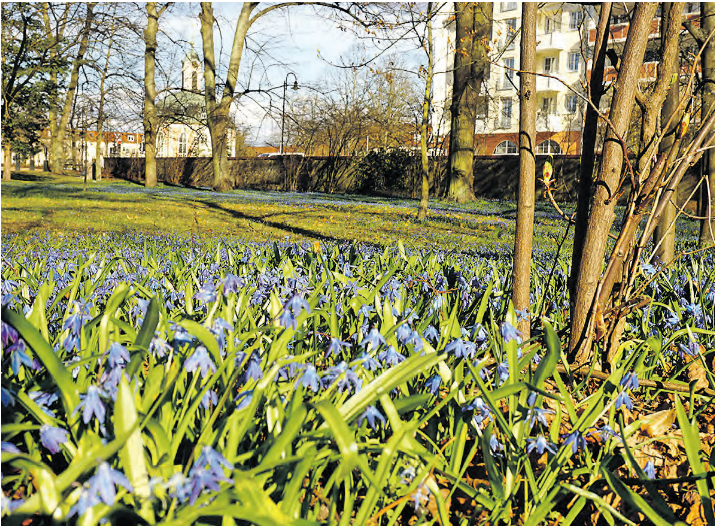
Die Blütenpracht erstreckt sich durch den Stadtpark.

mit „Amtsblatt für die Stadt Schwedt/Oder und für die Gemeinde Pinnow“ (bei Bedarf)