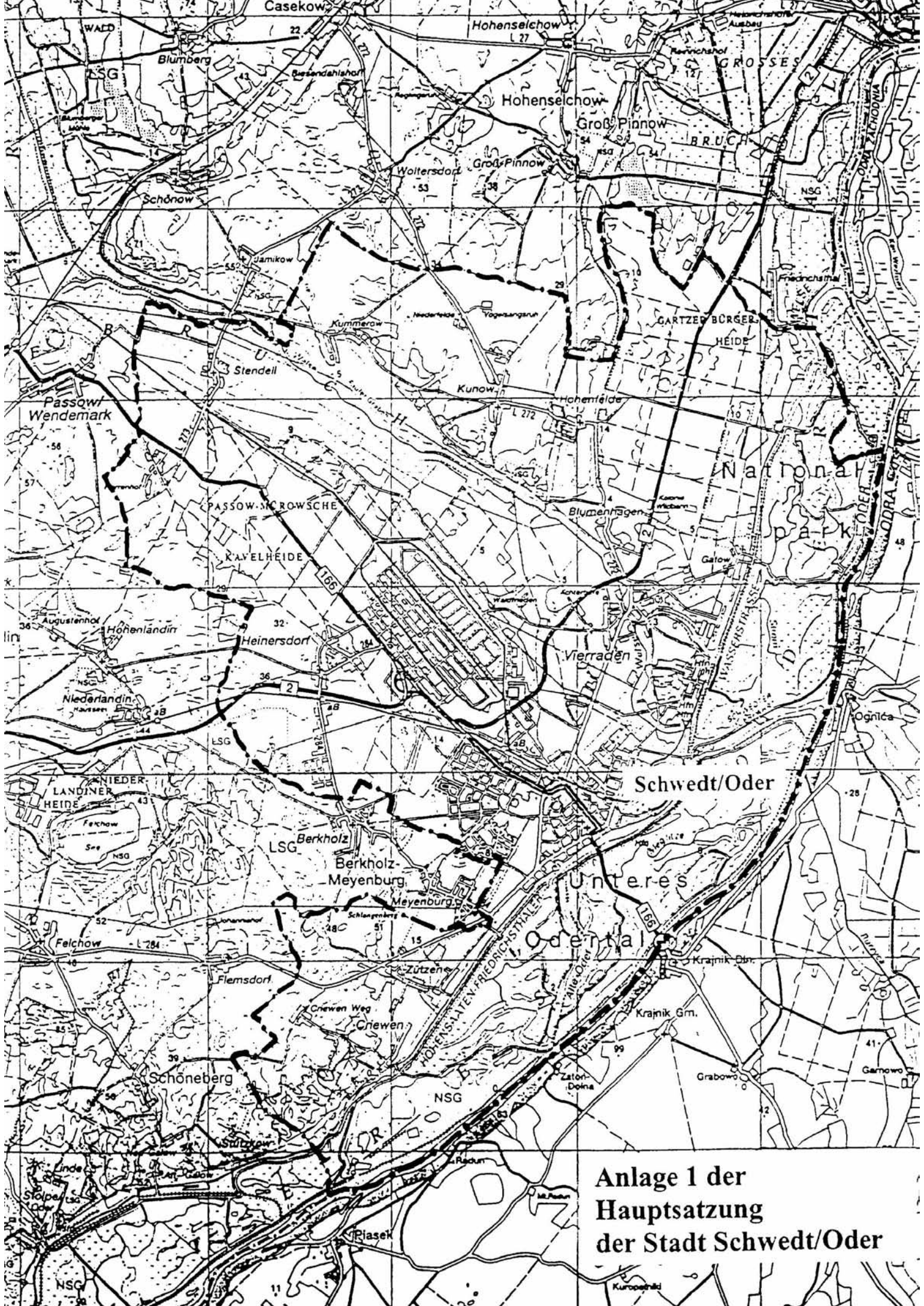
Anlage 1 der Hauptsatzung der Stadt Schwedt/Oder